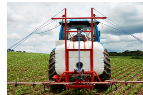
ALTURA CERTA LINHA GARDIEN C

Chassi e quadro compõe um conjunto de alta performance. São resistentes às mais severas condições de trabalho, garantindo segurança em qualquer operação.