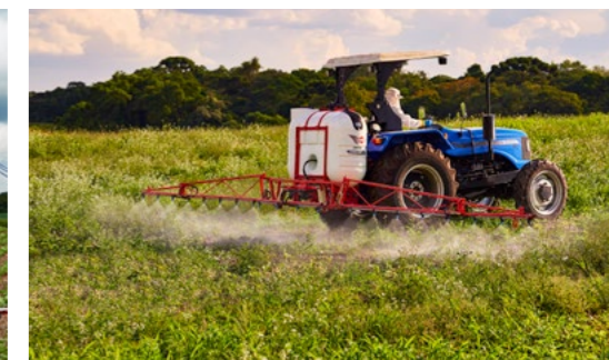
ECONOMIA QUALIDADE NA APLICAÇÃO

O conjunto torre da linha Gardien C possibilita vários ajustes de altura, que podem chegar até 1,65 metro. Com a praticidade que o agricultor precisa, é possível realizar estes ajustes sem a necessidade de ferramentas.