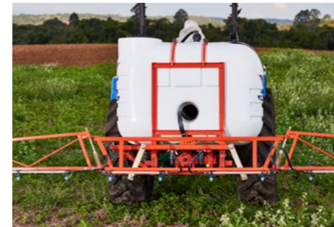
RESISTÊNCIA COMPROVADA QUADRO GARDIEN X

Chassi e quadro compõe um conjunto de alta performance. São resistentes às mais severas condições de trabalho, garantindo segurança em qualquer operação.